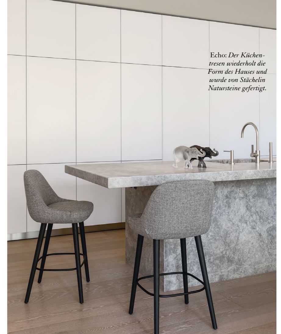
Echo: Der Küchentresen wiederholt die Form des Hauses und wurde von Stächelin Natursteine gefertigt.

«Als Sohn einer Handwerkerfamilie weiss ich präzise Patrons und deren Arbeitsethos zu schätzen.» DER BAUHERR