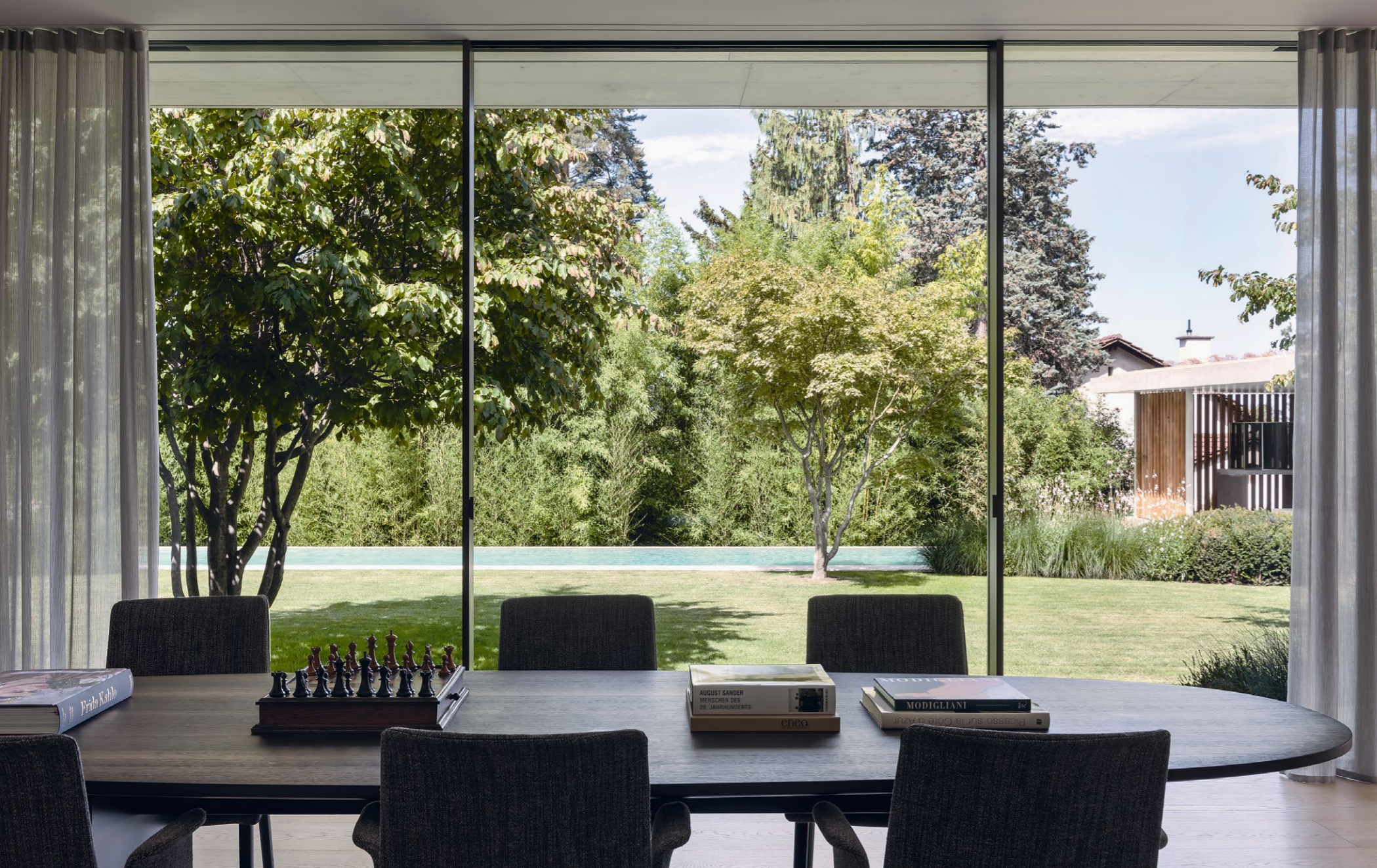
Gartenblick: Der Esstisch «Tix» ist von Zoom by Mobimex, das Ensemble mit den Stühlen von Alinea AG.

V on der Strasse aus zeigt sich der Flachbau bedeckt. Hinter dem bronzenfarbenen Metallzaun, dem Garten mit altem Baumbestand und einer Sichtschutzwand blitzt nur ein kleiner Teil des mit Holzlamellen strukturierten Eingangsbereichs auf. «Willkommen in meinem «Hortus conclusus»», sagt der Hausherr. Das kunstgeschichtliche Motiv des geschlossenen Gartens passt: So abgewandt von der Aussenwelt sein Refugium auf den ersten Blick wirkt, so offen und kontemplativ zeigt es sich von innen.